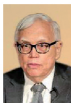
James Heckman 美国芝加哥大学教授 2000年诺贝尔经济学奖获得者