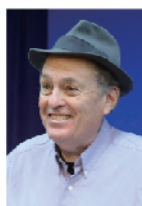
Richard B. Freeman 美国哈佛大学Herbert Ascherman 经济学讲席教授 美国人文与科学院院士