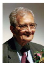
Amartya Sen 美国哈佛大学教授 1998年诺贝尔经济学奖得主