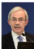
Christopher A. Pissarides 英国伦敦政治经济学院王室讲席教授 2010年诺贝尔经济学奖得主