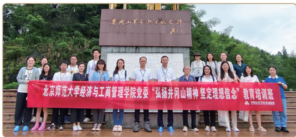
经济与工商管理学院党委“弘扬井冈山精神 坚定理想信念”教育培训班