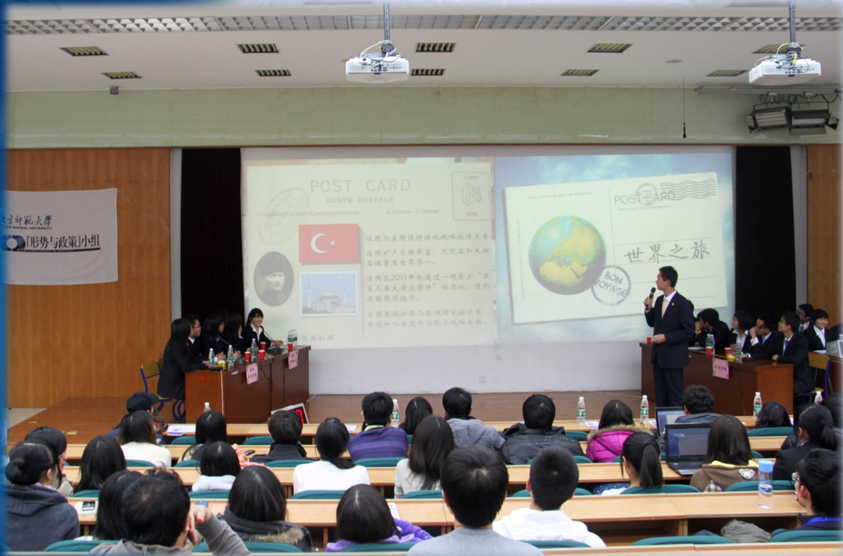
国际关系学院、北京外国语大学、外交学院、北京师范大学 四校选手同台竞技