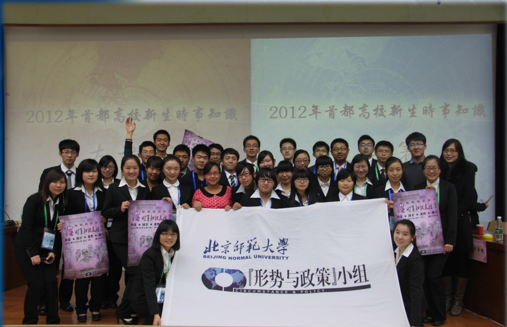
赛后嘉宾选手同工作人员合影