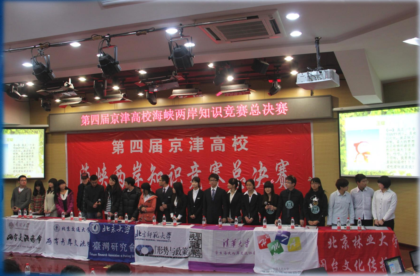
第四届海峡两岸知识竞赛比赛现场 七校精英齐聚北林