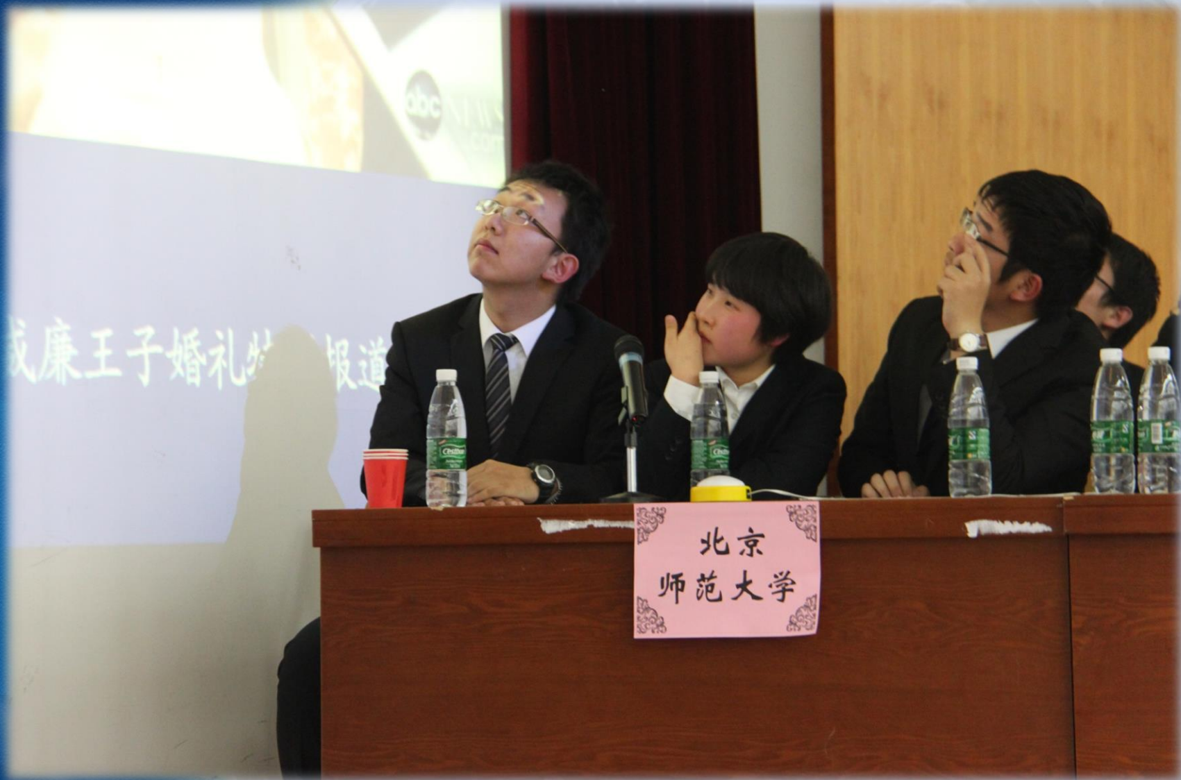
北京师范大学选手正在答题