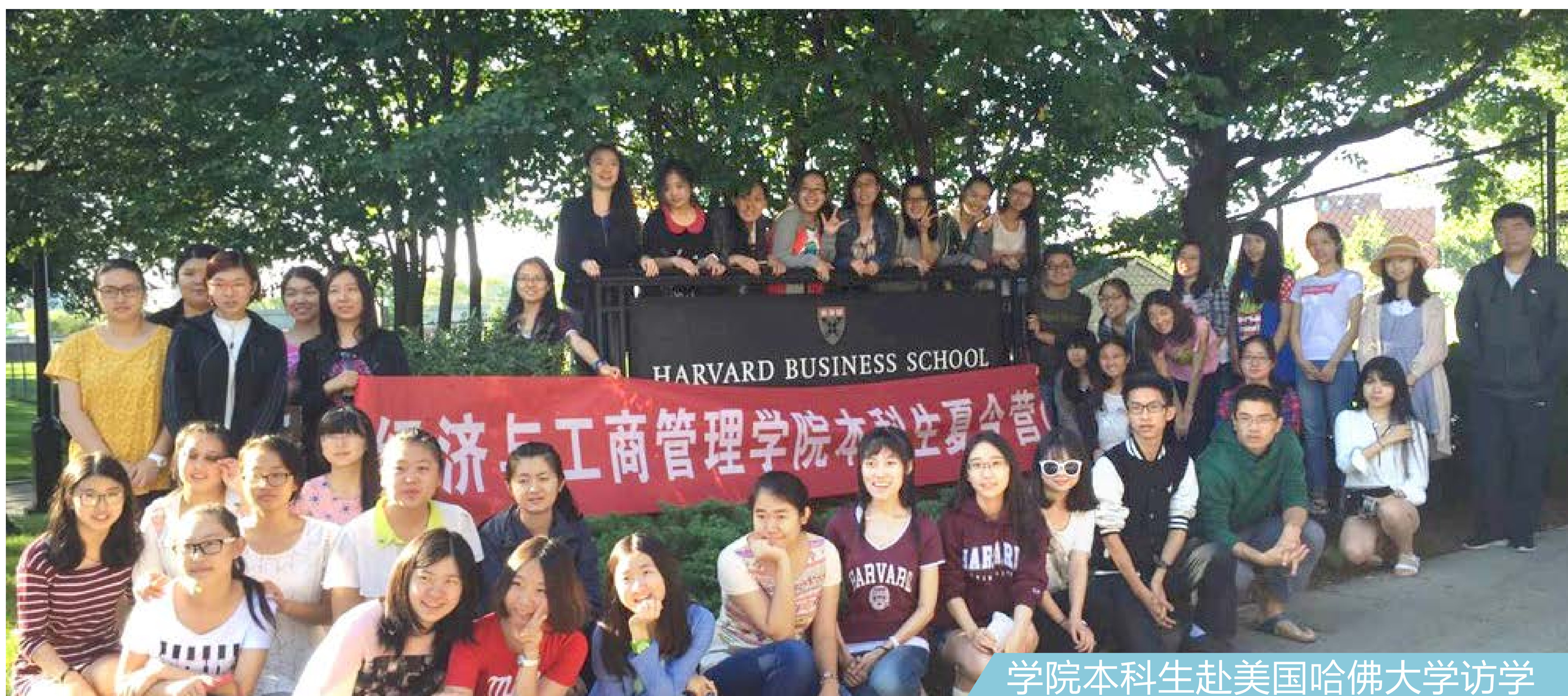
学院本科生赴美国哈佛大学访学

主要课程：微观经济学、宏观经济学、会计学、会计信息系统、财务会计、成本会计、财务管理、管理会计、税法、审计学、财务分析、国际会计等。