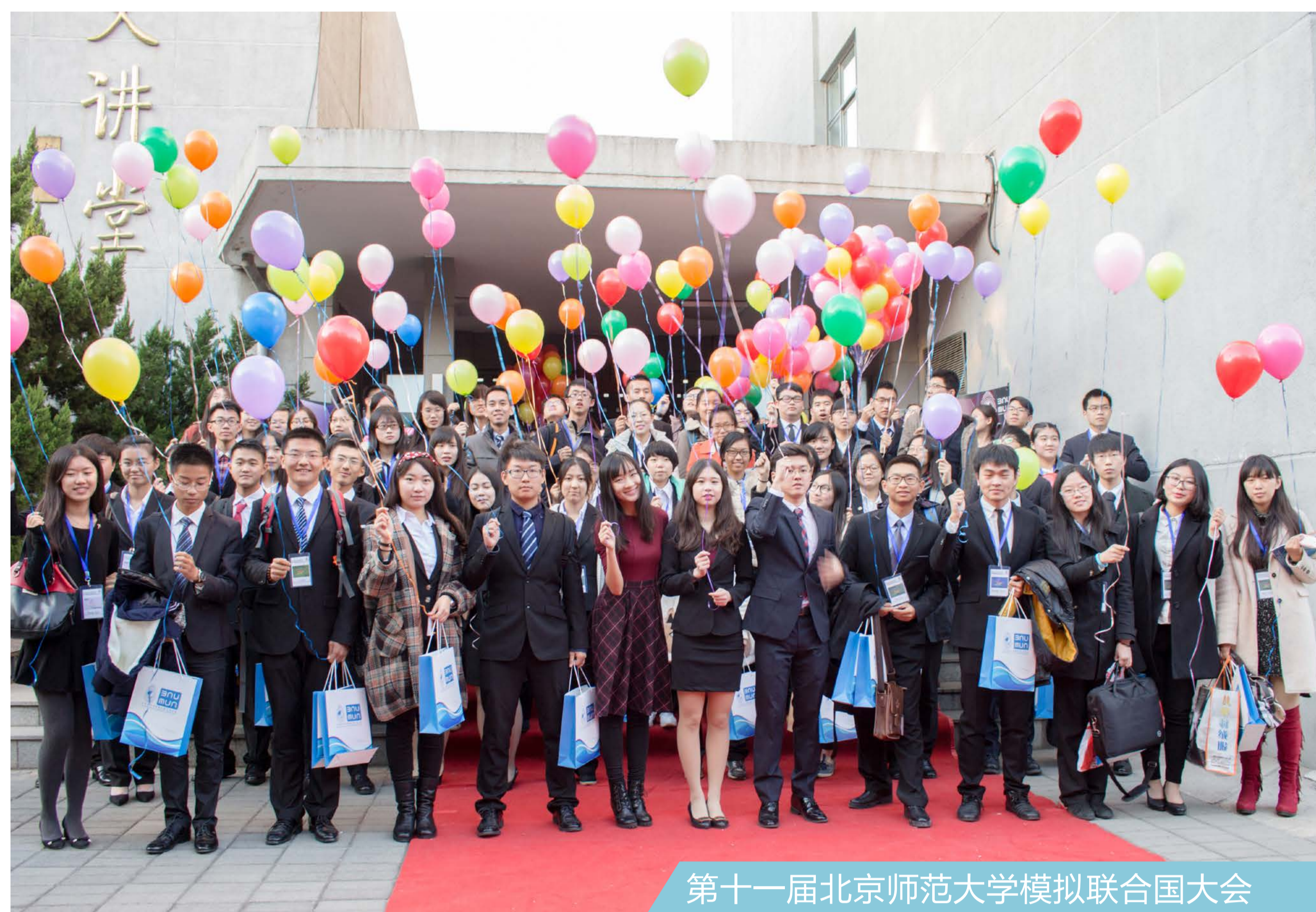
第十一届北京师范大学模拟联合国大会